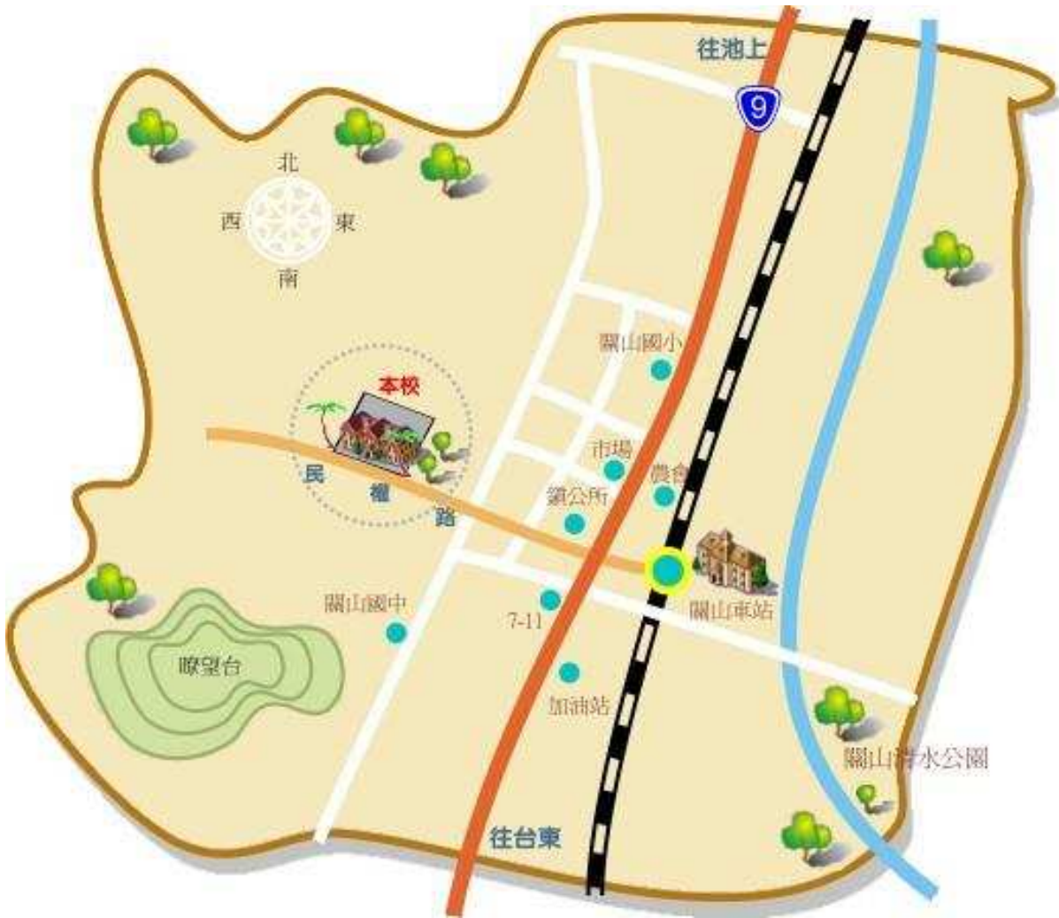
附圖一 承辦學校位置圖