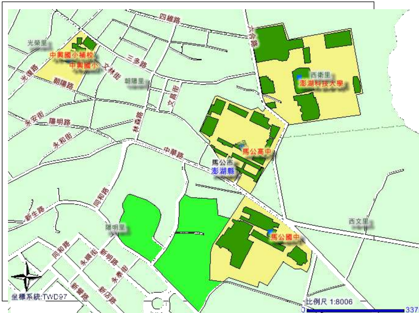
附圖、國立馬公高級中學位置交通路線簡圖