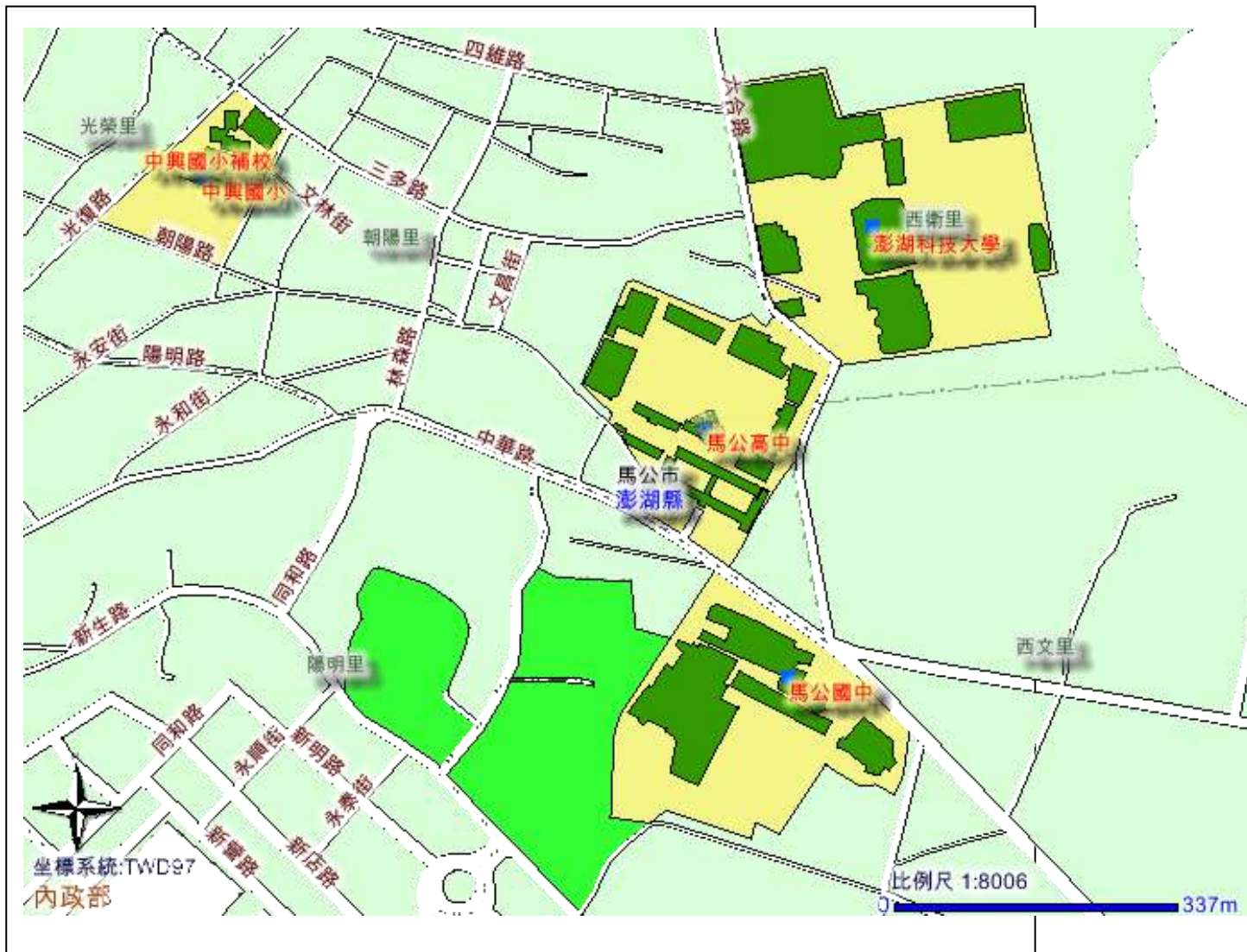
附圖、國立馬公高級中學位置交通路線簡圖