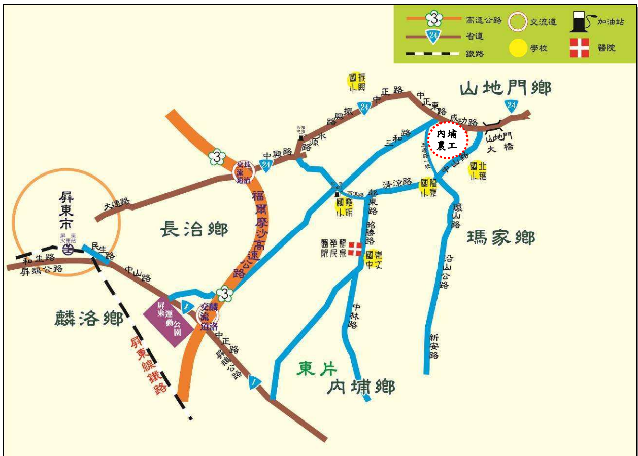
圖一、承辦學校位置圖